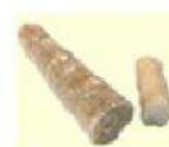
Porosas y ligeras. Con restos vegetales.