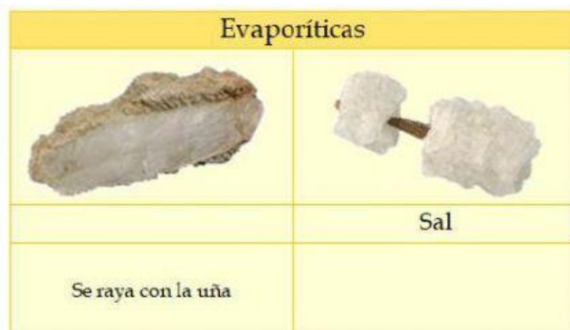
Tiene sabor salado.