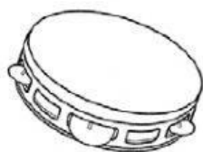
Tamburello a sonagli