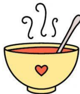
Sopa con avena