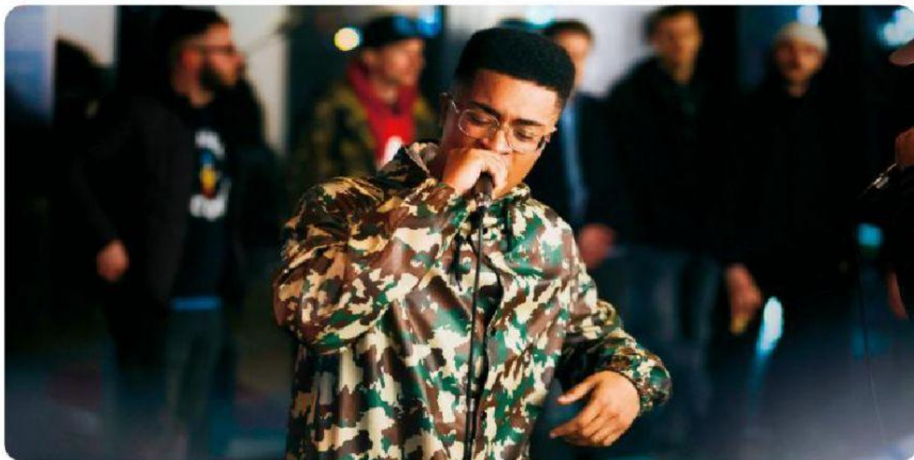
Um rapper criando rimas ao vivo para o público.

O rap (do inglês rhythm and poetry – que significa ritmo e poesia) surgiu na Jamaica na década de 1960 e chegou aos bairros pobres da cidade de Nova York na década de 1970. Em Nova York, a música dos jamaicanos ganhou novas influências das populações locais, que viviam nos guetos ou bairros pobres, conquistando as ruas e o apreço das pessoas. Por meio do rap , indivíduos que viviam de maneira marginalizada socialmente criaram uma forma de denunciar as situações de desigualdade social e violência e de expressar também seus desejos e sonhos.