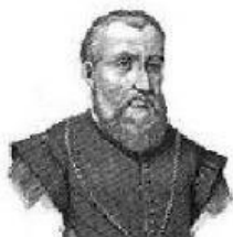
Gobernador de Cuba.