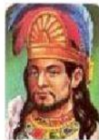
Emperador azteca que gobernaba México Tenochtitlan a la llegada de los españoles.