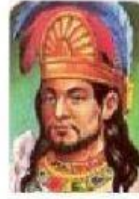
Emperador azteca que gobernaba México Tenochtitlan a la llegada de los españoles.