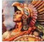
Último emperador azteca que fue apresado por los españoles, con lo que se consumó la conquista.