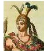
Cacique gobernante de los totonacas, que se aliaron con Cortés.