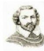
Cuando Cortés salió para enfrentar a las tropas de Pánfilo de Narváez, quedó encargado de Tenochtitlan.