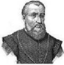
Gobernador de Cuba.