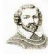
Cuando Cortés salió para enfrentar a las tropas de Pánfilo de Narváez, quedó encargado de Tenochtitlan.