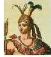
Cacique gobernante de los totonacas, que se aliaron con Cortés.