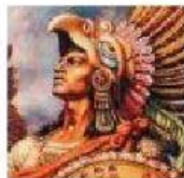
Último emperador azteca que fue apresado por los españoles, con lo que se consumó la conquista.