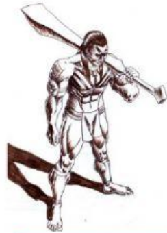
Figura de tres puntas