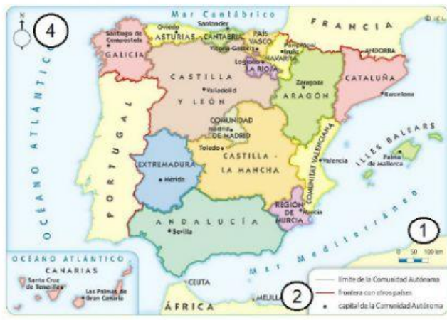
Mapa de las Comunidades Autónomas de España (3)

Escribe el número que le corresponde a cada elemento del mapa: