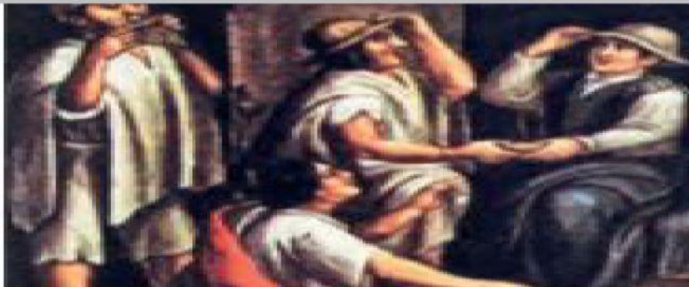
Rebelión de estancos