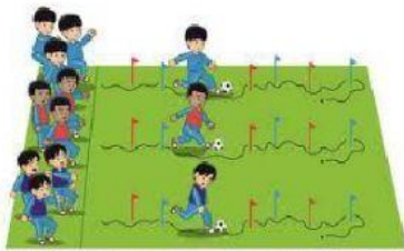
Gambar 1.11. Aktivitas pembelajaran sepak bola dengan materi: teknik yang dipelajari siswa