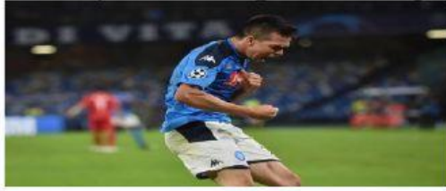
Lozano celebrando gol con Nápoles el 8 de mayo