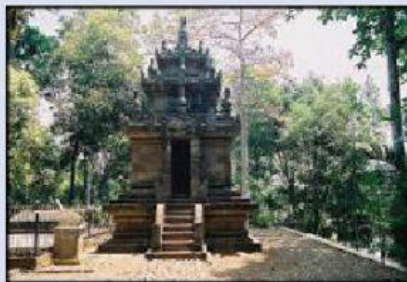
Raja Purnawarman, Panji Segala Raja

Raja Purnawarman mulai memerintah Kerajaan Tarumanegara pada tahun 395 M. Pada masa pemerintahannya, ia selalu berjuang untuk rakyatnya. Ia membangun saluran air dan memberantas perompak.