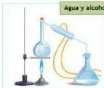
Agua y alcohol