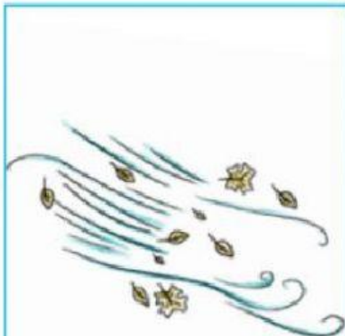
A. Había mucho viento.

2.- ¿Por qué el soldadito salió volando por la ventana?