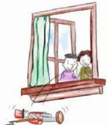
C. Los niños lo tiraron por la ventana.