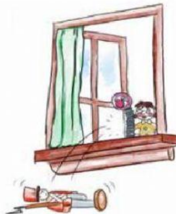
B. Otro juguete lo empujó.