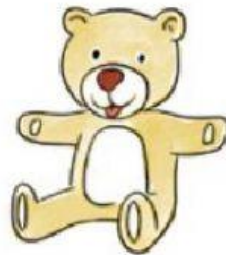
B. El oso.