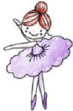
C. La bailarina.

2.- ¿Por qué el soldadito salió volando por la ventana?