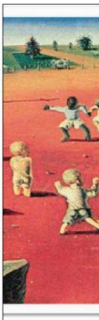
Obra: "Futebol em Brodosqui" - Cândido Portinari - 1935