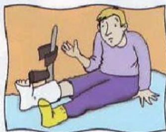
b. romperse una pierna