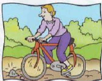
a. ir en bicicleta

Cuando estábamos merendando, llegaron los Martínez.