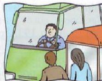
f. llegar el autobús