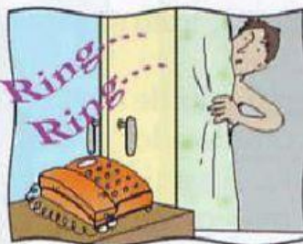
d. sonar el teléfono