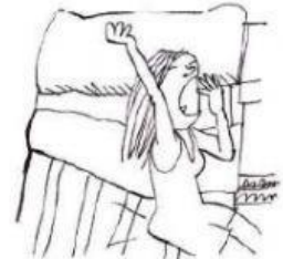
Ana se levanta a las siete.