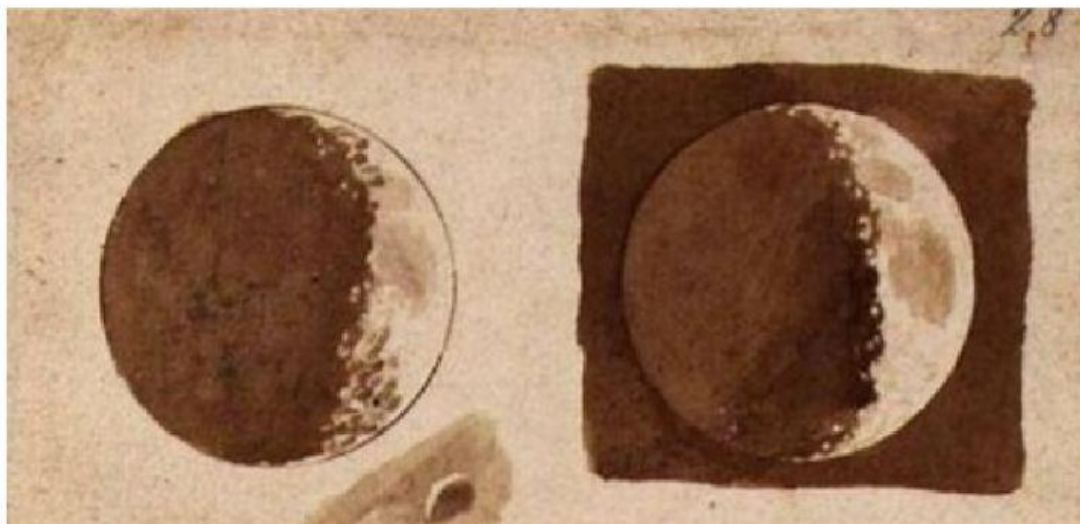
Fasi lunari. Da un disegno di Galileo Galilei - 1609