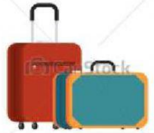
HIPERÓNIMO E HIPÓNIMO

Propagar- difundir Frágil- sólido Tuvo que cambiar todos los tubos Felinos- tigre Psiquiatra-oculista- cardiólogo Amplio- reducido Esta tarde llegaré tarde Deseo que se cumplan todos vuestros deseos Pedir- conseguir Idéntico-diferente Tras saber que su herida no tenía cura, hicieron venir al cura para darle la extremaunción Excusa- disculpa Cuando llegue a cuarto tendré mi propio cuarto porque necesitaré más espacio Ojear- hojear Febrero- meses Inverosímil- increíble Pico (herramienta)- pico (extremidad de las aves) No creo que haya hayas en ese bosque Culto- ignorante Cerca de esa valla hay bayas venenosas Aragón- Cataluña Humilde- sencillo