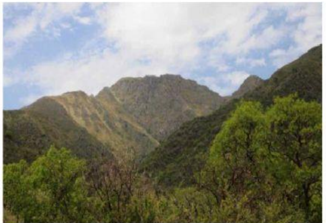
CERRO URITORCO, CÓRDOBA