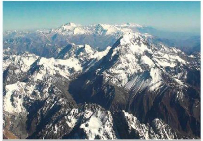
CORDILLERA DE LOS ANDES