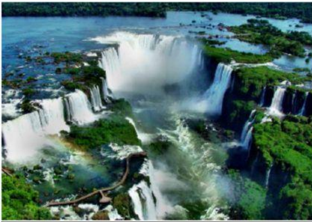
CATARATAS DEL IGUAZÚ