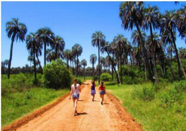
EL PALMAR, ENTRE RÍOS