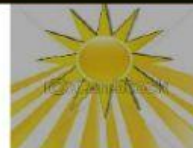
(raios de sol)

9) ARRASTE AS RESPOSTAS PARA BAIXO DE CADA UMA DAS PERGUNTAS DE ACORDO COM A LETRA DA CANÇÃO: