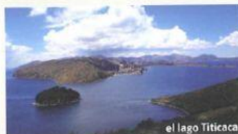
el lago Titicaca