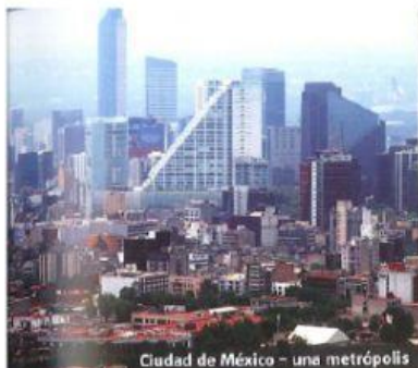
Ciudad de México - una metrópolis