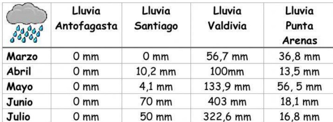
Tabla de cantidad de lluvia según ciudad

Resolver problemas con información de tablas