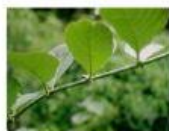
Uña de gato