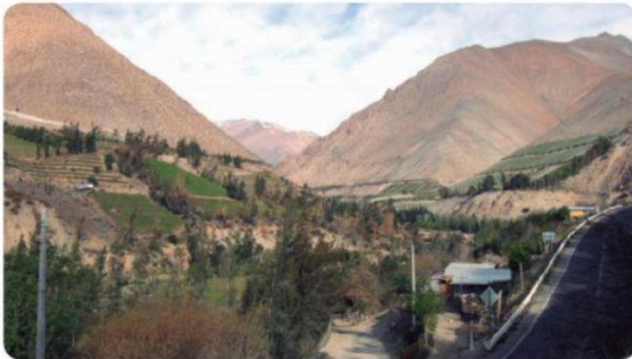
▲ Valle del Elqui, región de Coquimbo, Chile.

¿Qué elementos naturales del paisaje puedo reconocer?