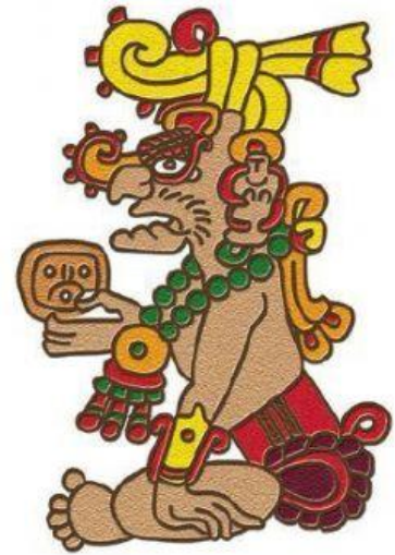
Itzamná , dios de la sabiduría.

a. Acabas de plantar los cultivos y necesitas de mucha lluvia para que crezcan bien.