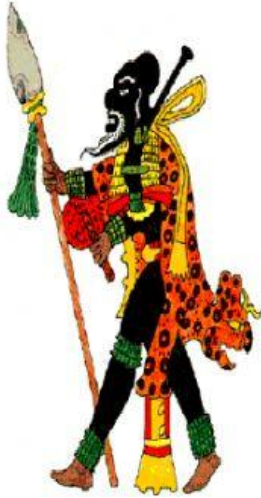
Ek Chuah , dios de la guerra