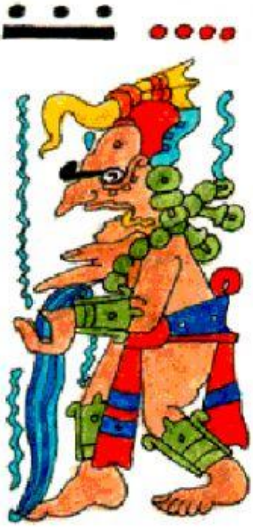
Chaac , dios de la lluvia

2. Imagina que eres maya. Lee las situaciones y une el nombre del dios al que deberías pedirle ayuda con la situación que corresponda.