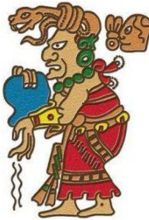
Ixchel diosa de la luna, inventora del tejido.