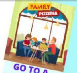
GO TO A RESTAURANT