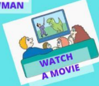
WATCH A MOVIE