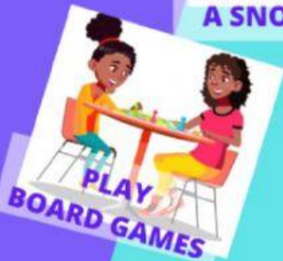
PLAY BOARD GAMES