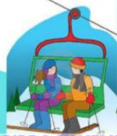
RIDE A CHAIRLIFT