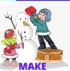
MAKE A SNOWMAN