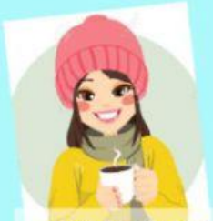
DRINK HOT CHOCOLATE