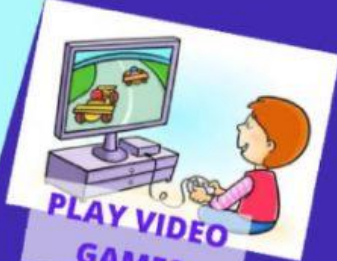
PLAY VIDEO GAMES