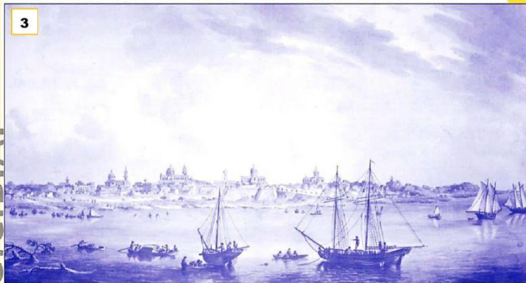
▲ "Vista de Buenos Aires desde el camino de las Carretas". Aguada de Fernando Brambila, 1794.