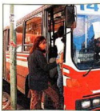
En las grandes ciudades, los colectivos recorren todos los barrios.