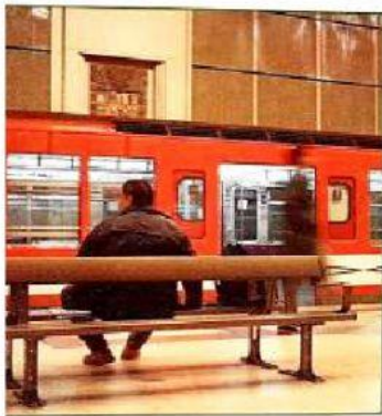
El subterráneo permite viajar en pocos minutos de un lugar a otro de la ciudad.

En la Ciudad de Buenos Aires hay trenes, subterráneos, colectivos y taxis como medios de transporte público. En los últimos años, crecieron mucho los desplazamientos en automóviles particulares. Las bicicletas y las caminatas también se consideran formas de desplazarse.