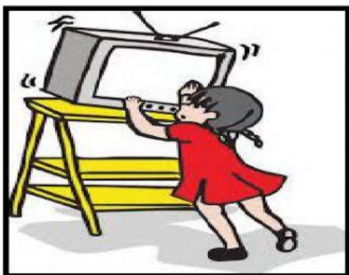
Coger los objetos para que no se dañen.