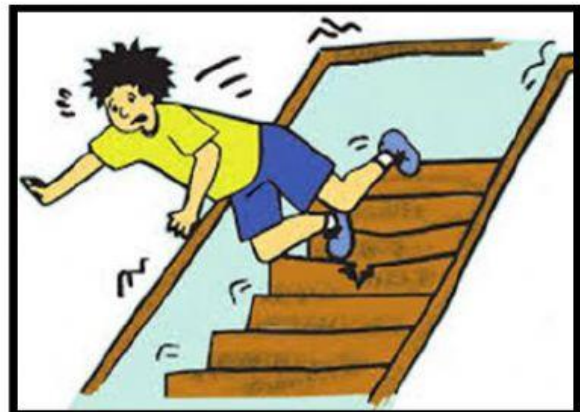
Bajar de prisa por las escaleras.