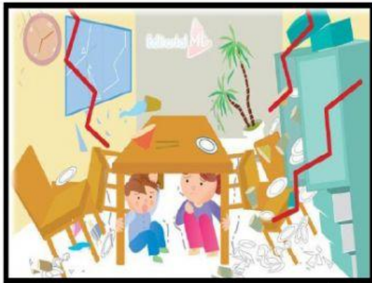
Colocarse debajo de la mesa.