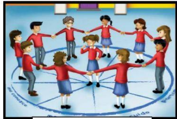
Realizar un círculo de seguridad .