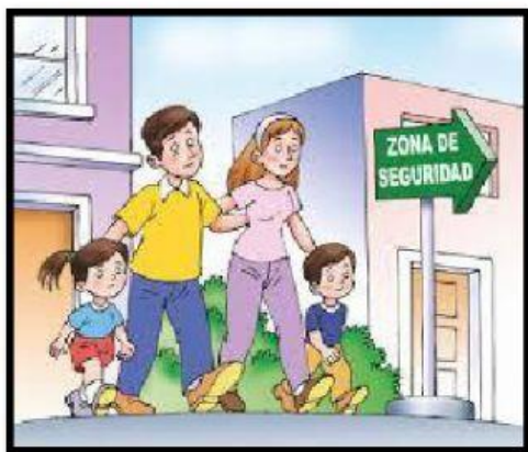
Salir de manera calmada y buscar un lugar seguro.