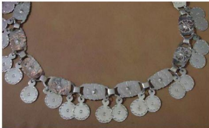
Collar de plata

Utilizaban ornamentos para espantar malos espíritus.