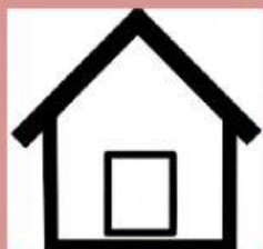
Superfície casa: 50 m 2

A) A quantes cases equival aquesta tanca? És a dir, quantes vegades podem posar aquesta casa dins de la superfície de la tanca?