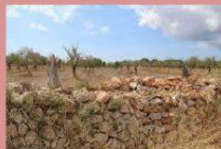
Superfície tanca: 3 dam 2