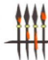
una verja se oxida