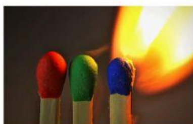
Encender una cerilla