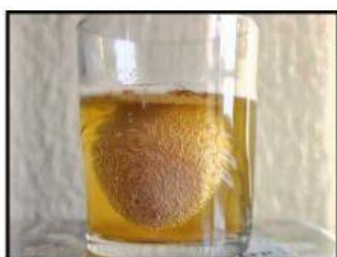
Huevo en vinagre