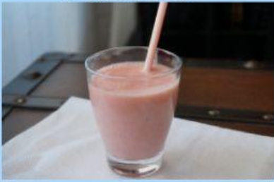
Batido de fresa