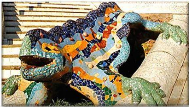
Escultura del Parque Güell (Barcelona).