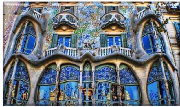
Casa Batlló (Barcelona).

La obra más famosa de Gaudí es la catedral de "la Sagrada Familia" de Barcelona, pero la catedral no fue comenzada ni terminada por él. Le ofrecieron este encargo una vez empezadas las obras, en 1883 y Gaudí cambió por completo el diseño inicial convirtiéndola en su obra cumbre. Lamentablemente murió en 1926, a los 74 años, antes de verla terminada.