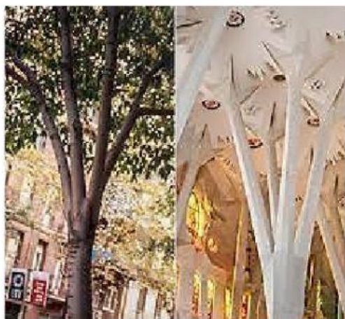
Columnas inspiradas en las copas y troncos de los árboles.