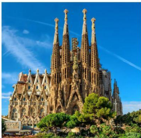
IMÁGENES DE LA SAGRADA FAMILIA DE BARCELONA.

Siete de las obras de Gaudí han sido reconocidas como Patrimonio de la Humanidad.