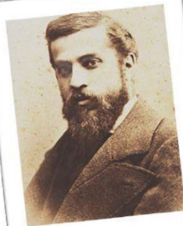
Antoni Gaudí, 1878.

Antoni Gaudí i Cornet nació cerca de la ciudad Tarragona (Cataluña) en 1852. Fue un niño que sufrió muchos problemas de salud cuando era pequeño, por lo que pasó muchas temporadas recuperándose en la casa de campo de la familia, observando la naturaleza, las plantas, los animales... Su padre era calderero ( persona que reparaba y hacía calderos y otros recipientes de metal ), al igual que su abuelo y Gaudí aprendió de ellos a manejar el metal ya que les ayudaba siempre que podía y su salud se lo permitía.