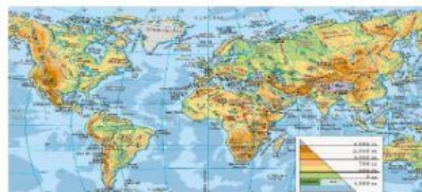
PLANISFERIO O MAPAMUNDI