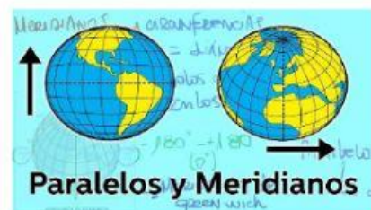
LINEAS IMAGINARIAS PARA LOCALIZAR PUNTOS