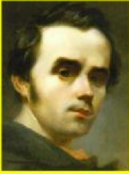
Учасник гуртка «Руська трійця»