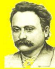
Учасник Кирило- Мефодіївського товариства