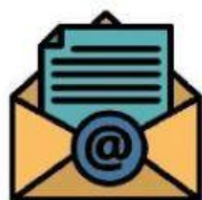
El correo electrónico