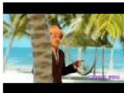
Lyricstraining – Si t'as été à Tahiti