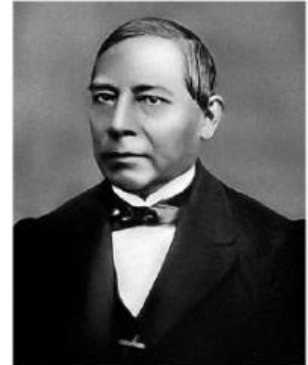
Presidente Benito Juárez (liberal)