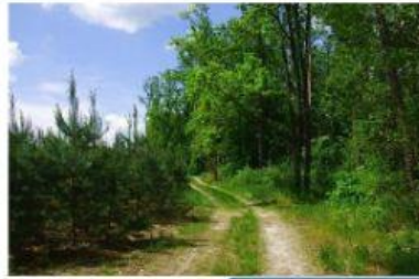
Сосна, дуб -