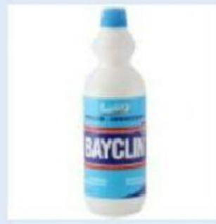
Gambar 5. Pemutih pakaian