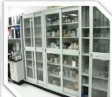
Gambar 1.13: Penyimpanan bahan kimia.

Laboratorium kimia adalah tempat atau ruangan tertentu yang dilengkapi dengan peralatan dan bahan kimia untuk mengadakan atau melakukan percobaan. Didalam sebuah laboratorium kondisinya lebih berbahaya dari pada ruangan lain. Tentu saja berhubungan dengan penggunaan bahan kimia dan alat tersebut berpotensi terjadinya hal yang tidak diinginkan seperti kecelakaan kerja. Untuk itulah perlunya mengetahui keselamatan kerja salah satunya dengan tata tertib di laboratorium. Aturan keselamatan di laboratorium dengan melengkapi atributnya yakni : pemakaian jas labor, masker, sepatu tertutup dan kacamata safety.