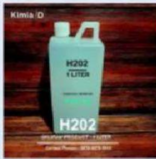
Gambar 4. Larutan H2O2