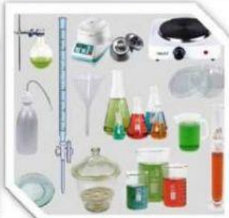
Gambar 1.12: Peralatan labor.