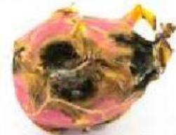
Gambar 1. Buah Busuk

Apabila buah-buahan diletakkan di udara terbuka atau di lingkungan yang panas, maka buah-buahan akan lebih cepat membusuk. Namun, saat buah diletakkan pada suhu rendah, reaksi pembusukan lebih lambat. Hal ini dipengaruhi oleh salah satu faktor laju reaksi. Kemukakan pertanyaan berdasarkan fenomena tersebut.