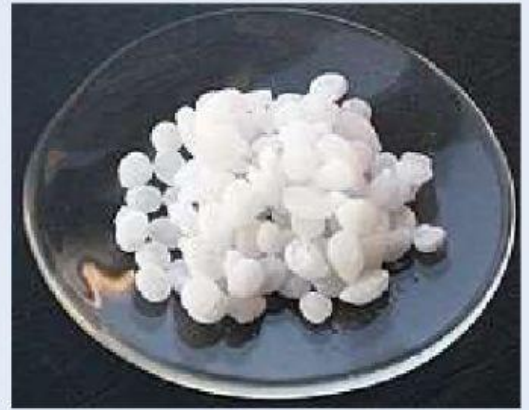
Gambar 3. \text{NaOH}

Contoh zat yang bersifat higroskopis adalah Natrium hidroksida ( \text{NaOH} ) berbentuk padatan berwarna putih. \text{NaOH} mudah meleleh jika diletakkan pada wadah terbuka karena memiliki sifat mudah menyerap air (higroskopis). Untuk itulah tempat penyimpanan yang harus disesuaikan dengan sifat tersebut. Zat-zat yang harus disimpan diatas suhu bekunya agar tidak membeku adalah asam asetat ( 17^\circ\text{C} ), anilin ( -5^\circ\text{C} ), benzene ( 5^\circ\text{C} ), asam sulfat ( 5^\circ\text{C} ) dan asam formiat ( 9^\circ\text{C} ). Beberapa hal yang perlu diperhatikan dalam penyimpanan adalah - wadah bahan kimia selalu tertutup dan berlabel; - waspada terhadap perubahan cuaca yaitu suhu tinggi dan hujan lebat.