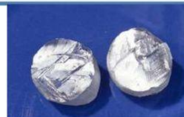
Gambar 2. Natrium

Diskusikan, mengapa cara tersebut lebih baik untuk penyimpanan logam natrium di laboratorium?