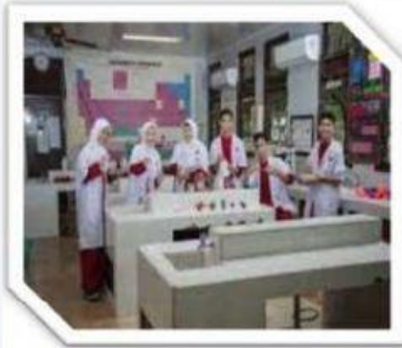
Gambar 1.11: Laboratorium