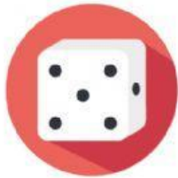
bau o dau