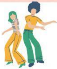
dallar o ballar