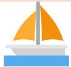
barca o darca