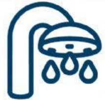
dutxa o butxa