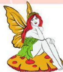
fada o faba