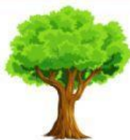
arbre o ardre