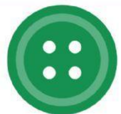
dotó o botó