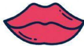
doca o boca