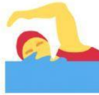
nebar o nedar