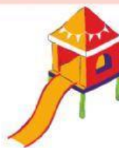
todogan o tobogan