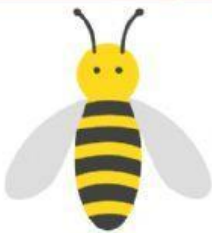
adella o abella