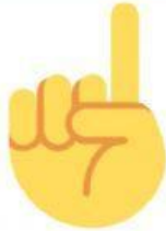
dit o bit