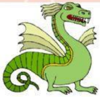
drac o brac

b b d b d d b d d b b d b d d b b d d b d b b d d d b b b d b d d b b d d b b d