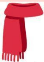
dufanda o bufanda