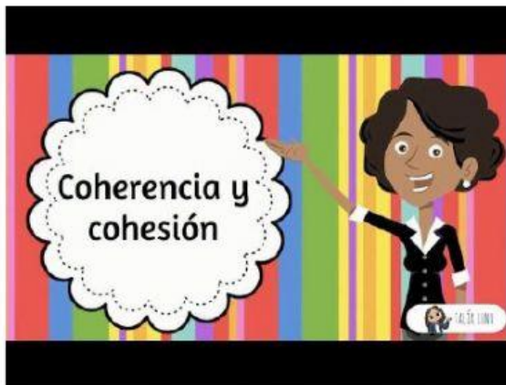
La coherencia y la cohesión