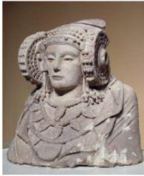
Dama de Baza

4.- Une cada imagen con su nombre. Ten cuidado porque hay nombres falsos.