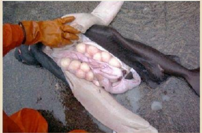
Huevos dentro de un tiburón