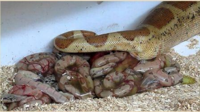
Serpiente dando a luz