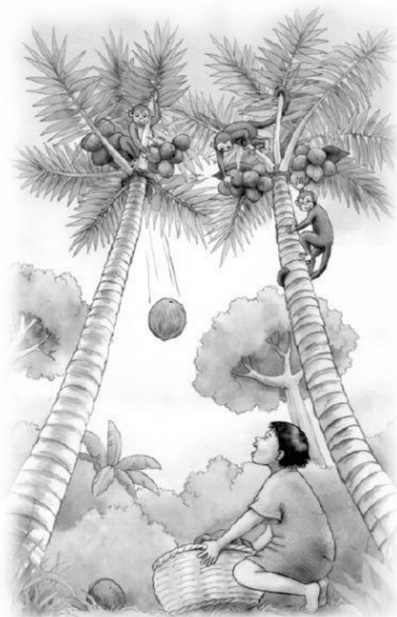
Ministerio de Educación del Perú, Oficina de Medición de la Calidad de los Aprendizajes, (2019). Kopi.

Entonces, los monos, agradecidos, ayudaron al niño a sacar los cocos de las palmeras. Kopi, muy contento, llenó la canasta y la llevó a su casa.