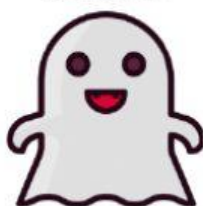
Une maison hantée