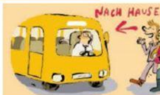
Nach Hause fahren