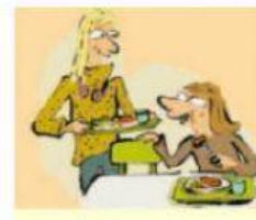
Zu Mittag essen