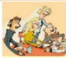
Zu Abend essen