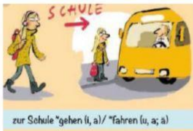
zur Schule *gehen (i, a)/ *fahren (u, a; a)