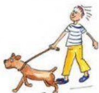
Den Hund rausführen