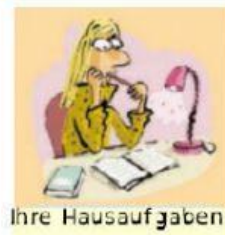
Ihre Hausaufgaben machen