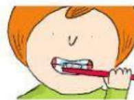
Die Zähne putzen