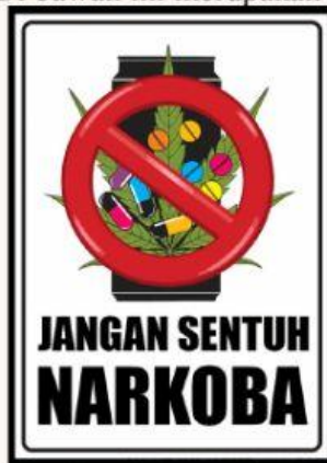
Gambar 1. Poster jauhi narkoba