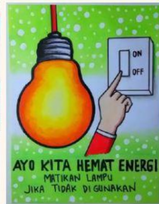
Gambar 3. Poster hemat energi