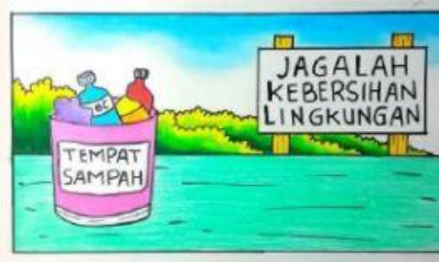
Gambar 2. Poster jaga kebersihan