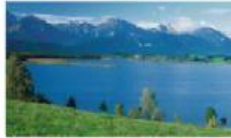
Der See( die Seen) : le lac