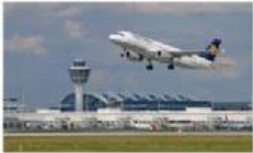
Der Flughafen(die Flughäfen) : l'aéroport

Zwei Touristen sprechen über ihre Reise deux touristes parlent de leur voyage