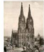
Der Dom( die Dome): la cathédrale