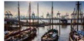
Der Hafen (die Häfen) : le port