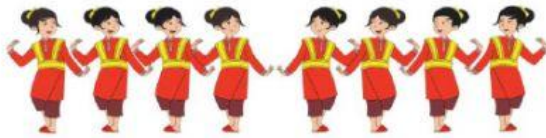
Tari Bungong Jeumpa dari Aceh.